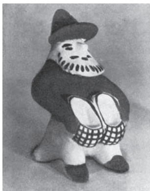
Шевелев А.П. Игрушка «Старик с лаптями». Глина. Каргополь. 1968 г.