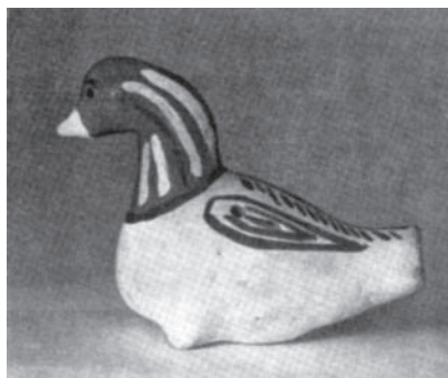
Дружинин Е. Свистулька «Птица». Глина. Печниково, Каргопольский район. 1968 г.