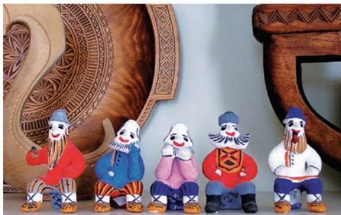
Группа мастеров. Из разных игрушек можно создавать сюжетные сценки. Современная каргопольская глиняная игрушка.