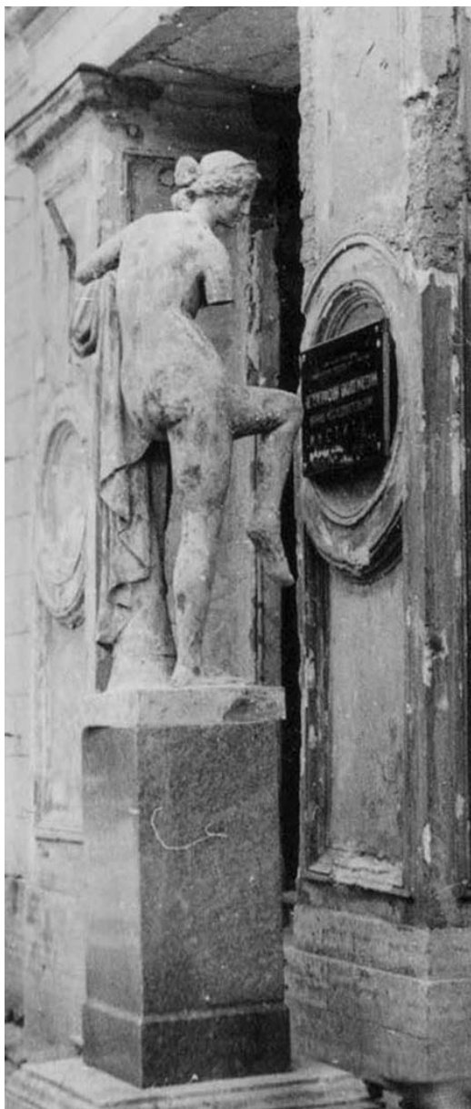
Рис. 3. Венера Сергиевская. Поврежденная скульптура, только что извлеченная из-под развалин дворца. Фото – июль 1960 г.