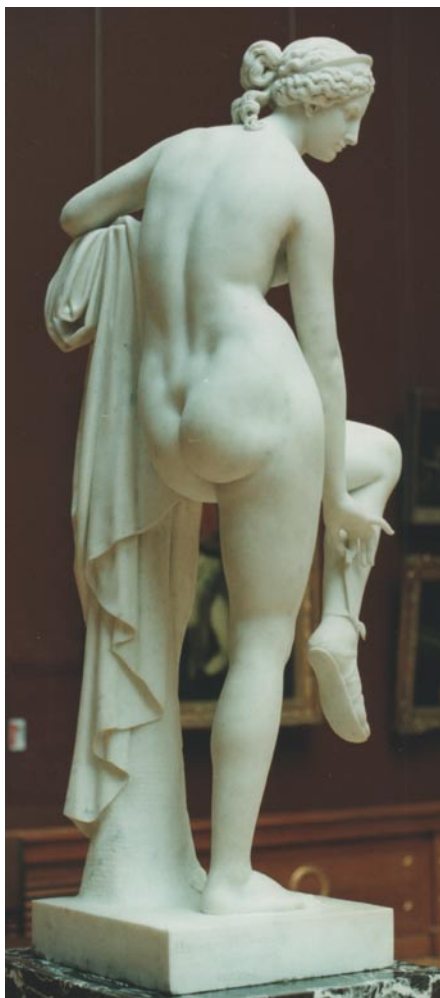
Рис. 1. Венера, снимающая сандалию. И.П. Витали. 1852. Мрамор. Государственный Русский музей. Фото – апрель 1999 г.