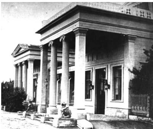
Рис. 2. Парадный вход дворца герцога М. Лейхтенбергского. Усадьба «Сергиевка». Старый Петергоф. Открытка, около 1907 г.