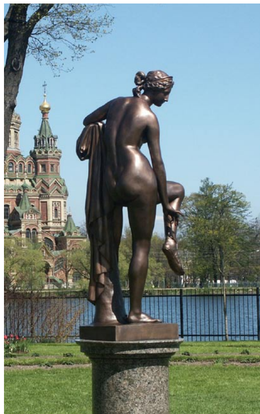
Рис. 7. «Венера Ольгиноостровская». Бронзовая копия. ГМЗ «Петергоф». Фото – 18 мая 2009 г.