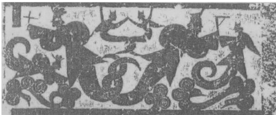
Фуци и Нюйва. Каменный рельеф. Восточная Хань. Шаньдун.