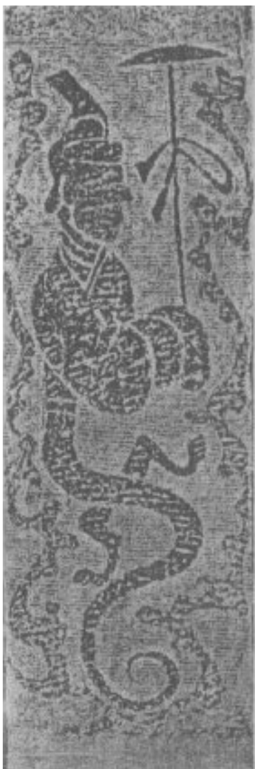
Фуци. Каменный рельеф. Восточная Хань. Хэнань. Наньян.