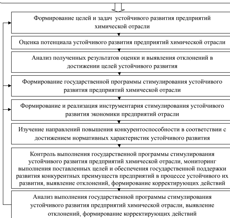
Рис. 2. Этапы реализации механизма государственного стимулирования устойчивого развития экономики предприятий химической отрасли