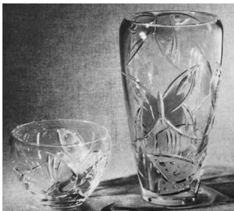
Рис. 1. Комплект ваз «Бабочки». 1961. Художник Х.М. Пыльд.