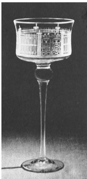
Рис. 3. Сувенирный бокал «Летний сад». 1967. Художник А.А. Аствацатурьян.