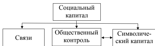
Рис. 2. Схема трансформации форм социального капитала

Практика организации хозяйственной деятельности постоянно формирует структуры общественного контроля возникающие вне экономически общественного нормотворчества. Так, например, в сфере науки и образования среди общественных организаций (Совет по науке при Минобрнауки, Общество научных работников) функционирует Комиссия общественного контроля по реформе в сфере науки.