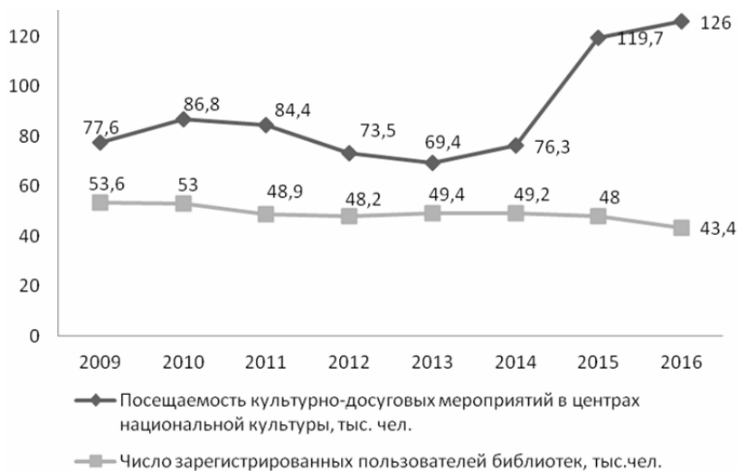
Рис. 3. Динамика посещаемости центров национальной культуры и зарегистрированных пользователей библиотек в РМЭ, тыс. чел.

– перевод фонда аудиокниг на цифровых носителях в спецформат для прослушивания на флэш-картах.