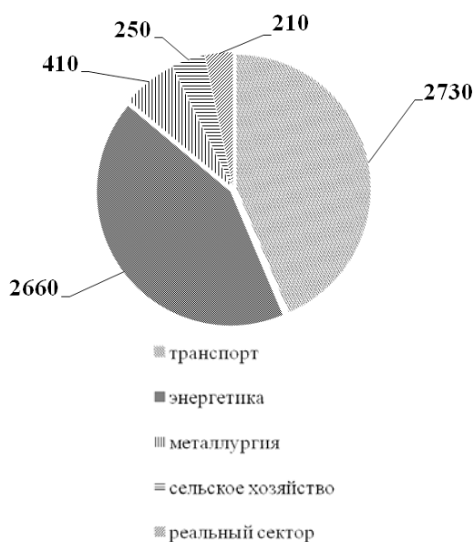
Рис. 1. Отрасли экономики Украины, которые привлекли наиболее крупные инвестиции из КНР в период 2005–2016 гг., в млн долл. США

Однако на протяжении всего периода независимости Украины первые места по объему прямых иностранных инвестиций (ПИИ) занимал вовсе не Китай. На конец 2016 г. основной объем прямых иностранных инвестиций в экономику Украины (в млрд долл.) поступал преимущественно из Кипра (11,7), Нидерландов (5,6), Германии (5,4), России (3,3), Австрии (2,4), Великобритании (1,85), Виргинских островов (1,7), Франции (1,5), Швейцарии (1,3), Италии (0,972) [4]. Стоит отметить, большая часть средств поступила из офшорных зон (Кипр, Виргинские острова, Нидерланды), что делает невозможным попытку установить источник капитала.