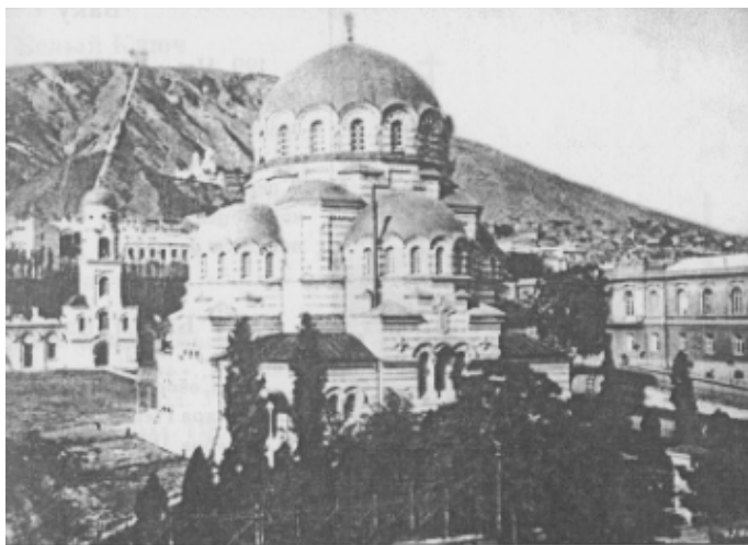
Собор святого благоверного князя Александра Невского