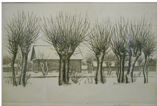
Еськов И.И. Зима в Полесье. 1978. Бумага, офорт