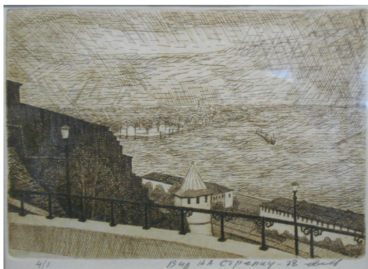
Еськов И.И. Вид на Стрелку. 1978. Бумага, офорт