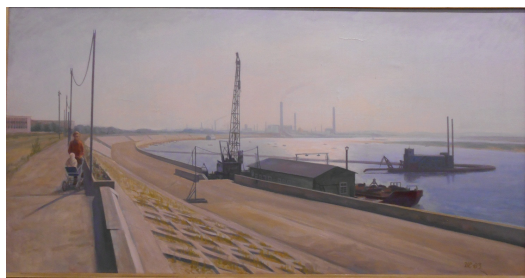
Еськов И.И. Новая набережная. 1983. Холст, масло

Среди увлекающих Еськова жанров первое место занимает лирический пейзаж.