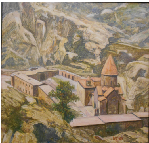
Еськов И.И. Гегард. 1981. ДВП, масло

ны датированные тем же 1978 годом офорты «Зима в Полесье» и «Зимний мотив», в которых и снег, и небо переданы цветом и фактурой неокрашенной бумаги.