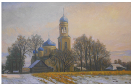
Еськов И.И. На тверской земле. 1990. ДВП, масло

Широко известные места Нижнего Новгорода – Кремль, Стрелка, Верхне-Волжская набережная, улица Рождественская – не выглядят на его холстах как стандартные достопримечательности, которые должен посетить каждый турист, и наполняются важным образным смыслом. Городские пейзажи Еськова – это всегда гармония природы и архитектуры, интенсивное, но сдержанно выраженное, поэтическое переживание. В этих работах нет изображения многолюдной уличной толпы и суеты: зритель остается с глазу на глаз с уголком города, давно любимым или только что открывшим нашему взгляду свою красоту.