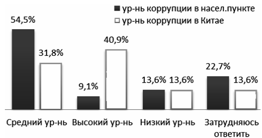
Рис. 2. Восприятие уровня коррупции гражданами КНР

Среди опрошенных нами молодых граждан КНР 27% считают задачу борьбы с коррупцией первоочередной, 36% – важной, но ничем не отличающейся от других задач. При этом уровень коррупции отмечают как высокий 40% опрошенных в Китае (рис. 2).