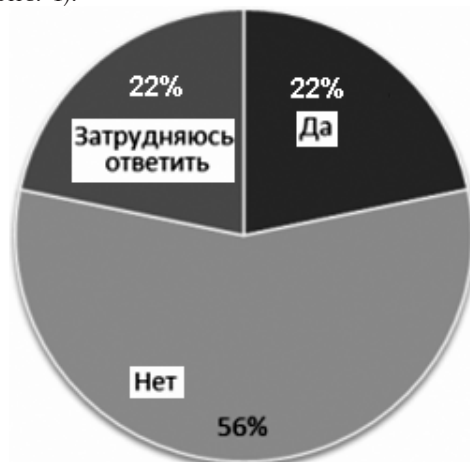
Рис. 3. Ответ молодых граждан РФ на вопрос «Знаете ли Вы, куда можно обратиться для защиты своих интересов, если у Вас вымогают взятку?»

нии коррупции. В качестве индикатора для определения информированности граждан был выбран вопрос «Знаете ли Вы, куда обратиться при вымогании у Вас взятки (для защиты своих интересов)?». Среди молодых граждан РФ положительно ответили 20,5%, отрицательно – 56,8%, ещё 22,7% затруднились ответом (рис. 3). Среди респондентов из КНР картина абсолютно иная: 81% знают, куда могут обратиться при вымогании у них взятки, не знает 5%, затруднились ответить 14% (рис. 4).